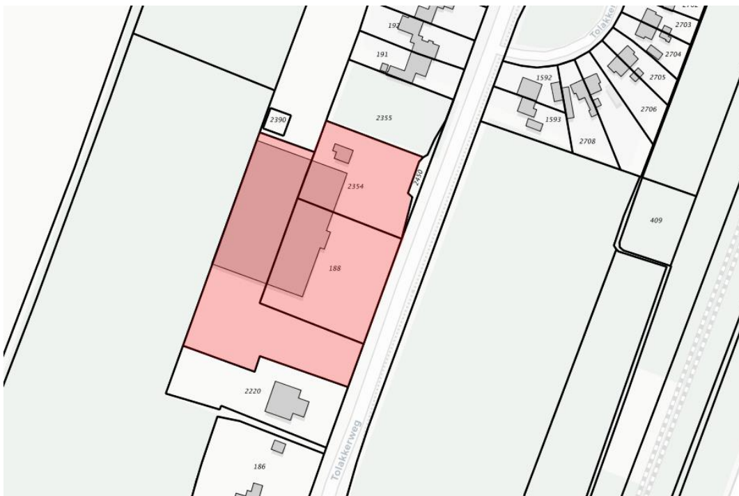
Fig 1. Plangebied met bestaande bebouwingscontouren en Tolakkerweg.

Op het perceel Tolakkerweg 138 – dat is gelegen aan de zuidzijde van de kern Hollandsche Rading - is sinds 2003 tuincentrum 'Karel Hendriksen' (voorheen Groenrijk) gevestigd. Het huidige tuincentrum bestaat uit een kassencomplex, verkoop in de open lucht en een parkeerterrein aan de voorzijde. Het perceel ligt dicht tegen de grens van het dorp Hollandsche Rading aan de Tolakkerweg. De Tolakkerweg is onderdeel van de provinciale weg N417 tussen Utrecht en Hilversum.