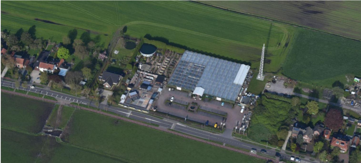
Fig 2. Vogelvluchtperspectief van het plangebied.

Het perceel heeft een oppervlakte van in totaal ca. 8.555 m 2 (exclusief het woonperceel gelegen in het zuiden van het plangebied). Het perceel wijkt sterk af van de overige bebouwing aan de Tolakkerweg waar verder geen grote bedrijven voorkomen. Direct ten zuiden van het perceel bevindt zich de grens van de bebouwde kom. De overzijde van de weg is hier open gebied. Aan de westzijde loopt het bebouwingslint nog 200 meter door in zuidelijke richting. Tot de bouw van het tuincentrum was het plangebied in gebruik als boomgaard. Ten westen van het plangebied bevindt zich het open veenweidegebied. De openheid is hier echter nog maar beperkt beleefbaar door het opgaand groen van het achtergelegen Dassenbosje.