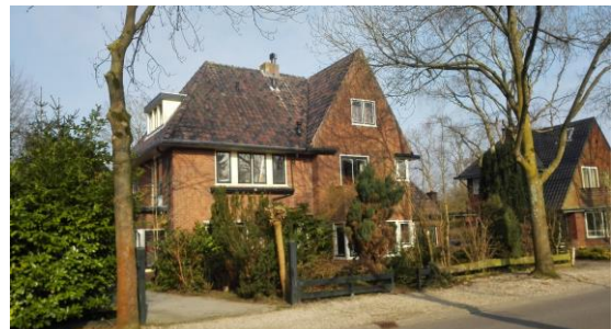
Fig 7. Beeld op de architectuur van de Tolakkerweg