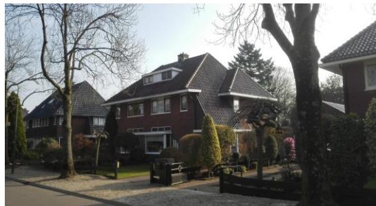
Fig 8. Beeld op de architectuur van de Tolakkerweg

De bebouwing langs de Tolakkerweg bestaat overwegend uit woonhuizen van twee lagen met kap. Agrarische bebouwing (doorgaans één laag met kap) komt veel minder voor. Hoewel met name sprake is van baksteenarchitectuur is de mate van variatie groot. Veel woningen hebben een eenvoudig zadeldak, maar samengestelde kappen, schilddaken en mansardekappen komen ook regelmatig voor. Vrijwel direct achter de bebouwing aan de oostzijde van de Tolakkerweg ligt de spoorlijn Utrecht-Hilversum en de Rijksweg A27.