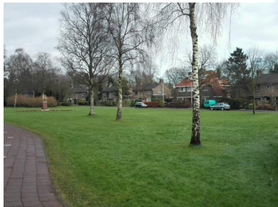
Fig 6. Beeld op een van de 2 omliggende hofjes