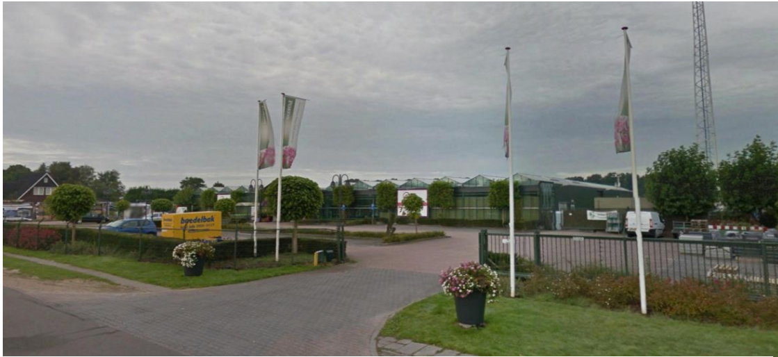
Fig. 4 Beeld op het voormalige tuincentrum vanaf de Tolakkerweg.

De aanwezige bebouwing van het tuincentrum op het perceel oriënteert zich primair op de Tolakkerweg, vanwaar het tuincentrum wordt ontsloten. De overige bebouwing aan de Tolakkerweg bestaat vrijwel uitsluitend uit vrijstaande woningen en tweekappers met veel tussenruimte. Vrijwel nergens is een doorzicht naar het achterliggende veenweidegebied en alle woningen zijn op de weg georiënteerd.