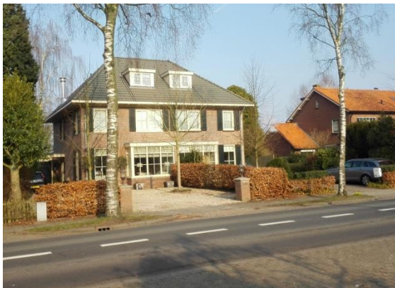
Fig 5. Beeld op de architectuur van de Tolakkerweg