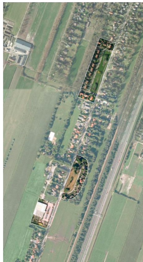
Fig 3. Het plangebied als 3 e hofje naast het "vierkantje" en "het rondje"

Twee opvallende ensembles langs de Tolakkerweg zijn het 'Rondje' en het 'Vierkantje'. Deze ensembles wijken af van de omgeving door hun projectmatige opzet en ligging ten opzichte van de straat. In beide gevallen is sprake van een riant open voorterrein waar al een klein beetje de openheid van het omliggende gebied ervaren kan worden. Een ander opvallend element langs de Tolakkerweg is de laanbeplanting van ranke berkenbomen.