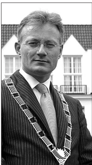
Financiën goed voor elkaar

"Veel gemeenten in Nederland hebben het financieel moeilijk. Ook in De Bilt is de financiële situatie niet makkelijk. Desondanks is het college er in geslaagd om met de voorjaarsnota 2007 een sluitende meerjarenbegroting te presenteren. Ook de financiën voor de programma's hebben we goed voor elkaar. Dat geeft me als nieuwe burgemeester een heel goed gevoel bij onze gemeente.