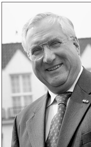
Geld voor oplossen situatie spoorovergangen

om de meest gewenste situatie te polsen."