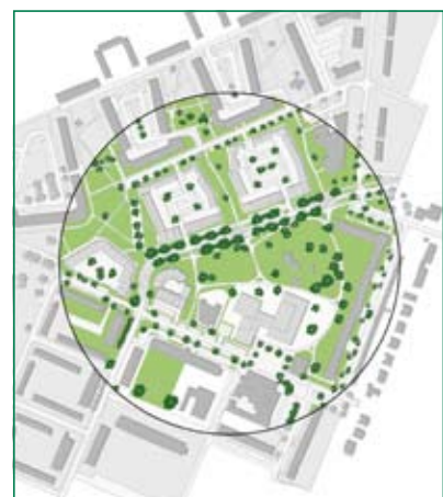
Groen, nieuwe situatie

Ter vergroting van de veiligheid en de leefbaarheid richt de gemeente de bestaande wegen opnieuw in. De Melkweg blijft een 30 km zone. Om te voorkomen dat auto's harder rijden wordt de weg daarop ingericht. Bewoners van de nieuwe woningen aan de noordkant kunnen hun auto parkeren op de binnenhoven in de nieuwe woonblokken. Daarnaast