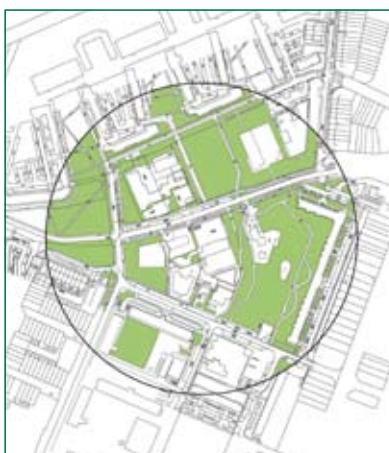
Groen, bestaande situatie

Het zuidelijke plandeel langs de Planetenbaan is de locatie voor de bouw van het Cultureel en Educatief Centrum. Deze locatie is gekozen omdat er op deze wijze een nieuwe ontmoetingsplek in de wijk ontstaat, samen met het bestaande winkelcentrum Planetenbaan.