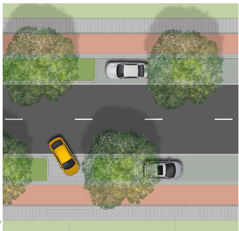
Detail inritten en parkeerplaatsen Schetsontwerp Leyenseweg